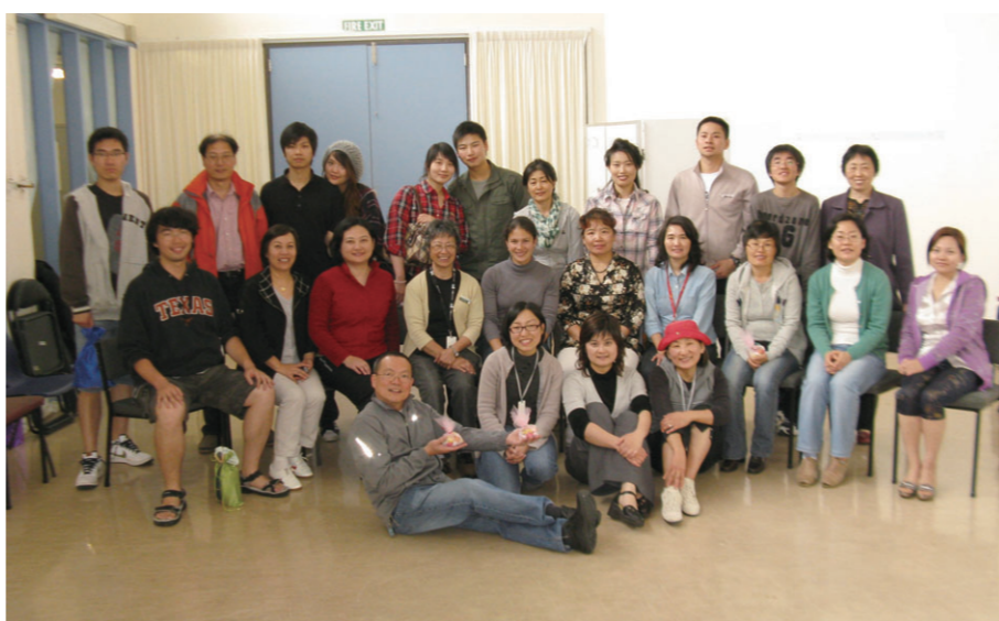
2009 年亚裔服务部义工联谊会

在这一年的义工活动中，我结交了许多良师益友，认识了很多新朋友。和他们在一起，让我学到了新的东西，生命和生活都充满了活力。